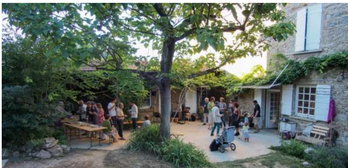
Les Choux Lents - Saint-Germain-au-Mont-d'Or (Rhône - 69)