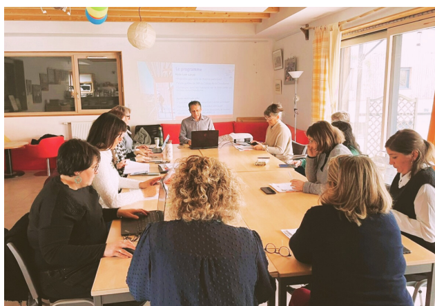
Formation "habitat participatif et vieillissement", auprès des acteurs des institutions de retraite complémentaire (IRC) de Malakoff Humanis et AG2R