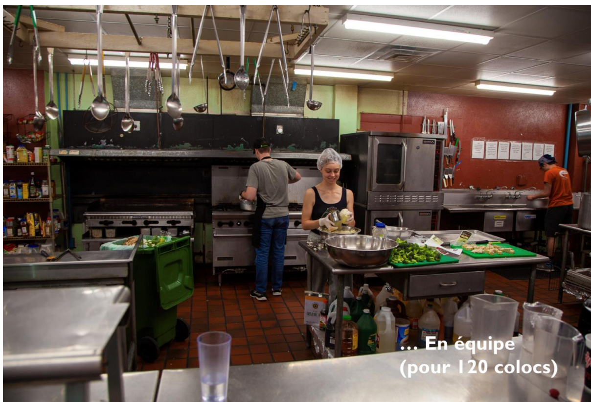
... En équipe (pour 120 colocs)