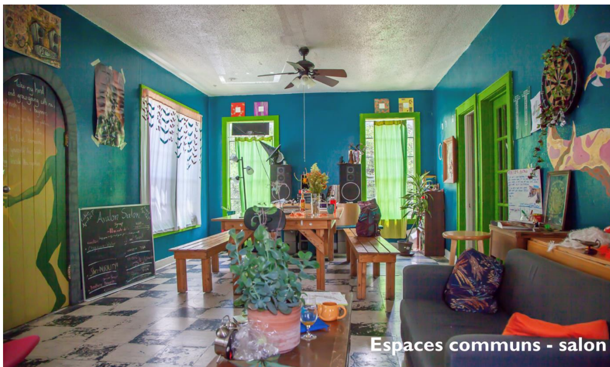
Espaces communs - salon