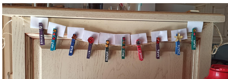
Exemple de SMS Low Tech offert à des copains d'éco hameau

Vivre sur un même lieu, le temps d'un weekend, ou le temps d'une vie, implique une bonne entente et une bonne communication entre les habitants. Plusieurs outils peuvent venir compléter les méthodes plus classiques de communications. Nous avons adoré l'usage du SMS Low Tech (alias le télégraphe suspendu, à vrai dire il cherche encore son nom). Le concept est simple, une pince à linge par personne avec son prénom dessus, des petits papiers sur lequel on peut écrire des messages et hop c'est parti ! Chaque membre peut laisser à d'autres des messages par écrit, anonymement ou de façon signé en pliant un petit message sur sa pince à linge. Chacun vient relever son courrier quand il le souhaite. Quel intérêt me direz vous ? Après tout, nous avons tous des téléphones portables désormais, non ? Et bien déjà, ça ne sera peut-être pas toujours le cas ! Et ensuite vous seriez étonné de voir comment les messages diffèrent des autres modes de communication. L'écrit oblige à la concision (plus long que de taper sur un écran), permet de se dire des petits mots qu'on aurait peut-être jamais osé/pensé dire en vrai (gratitude, remerciement, tension, blague). C'est le genre de petit soleil dont on a bien besoin pour aider au quotidien. Un outil à utiliser dès maintenant au sein de son foyer, de sa colloc', de son boulot et de son voisinage participatif !