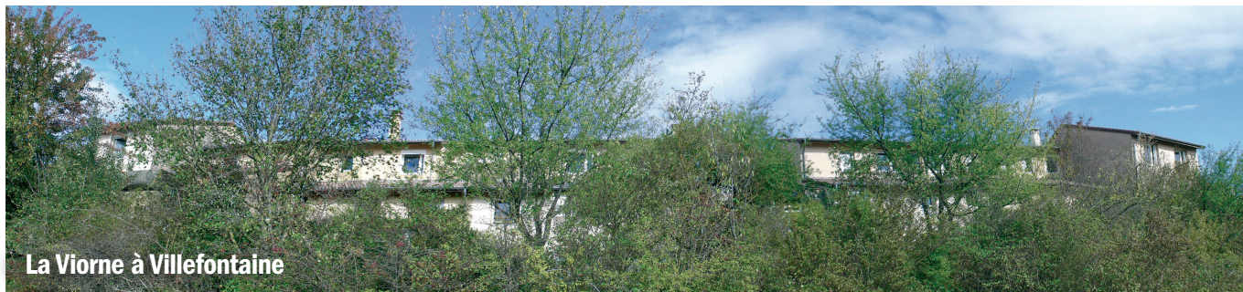
La Viorne à Villefontaine